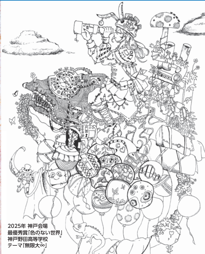
2025年 神戸会場 最優秀賞「色のない世界」 神戸野田高等学校 テーマ「無限大∞」

*スタンプラリー達成には条件があります。 *先着順。なくなり次第終了となります。